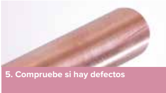
5. Compruebe si hay defectos