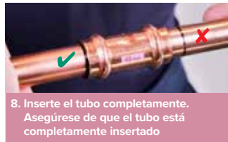
8. Inserte el tubo completamente. Asegúrese de que el tubo está completamente insertado