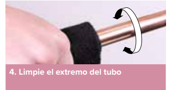
4. Limpie el extremo del tubo