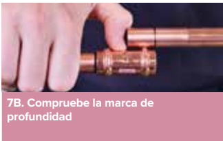
7B. Compruebe la marca de profundidad