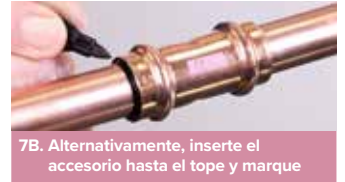
7B. Alternativamente, inserte el accesorio hasta el tope y marque