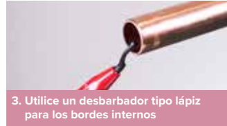
3. Utilice un desbarbador tipo lápiz para los bordes internos