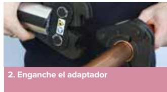
2. Enganche el adaptador