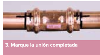
3. Marque la unión completada