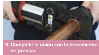
3. Complete la unión con la herramienta de prensar