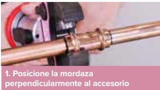
1. Posicione la mordaza perpendicularmente al accesorio