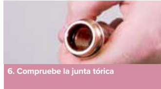
6. Compruebe la junta tórica