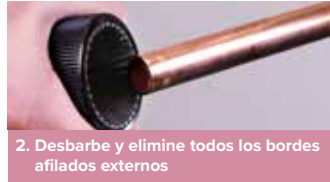
2. Desbarbe y elimine todos los bordes afilados externos