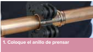
1. Coloque el anillo de prensar