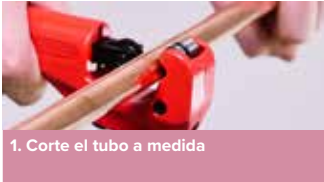
1. Corte el tubo a medida