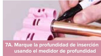
7A. Marque la profundidad de inserción usando el medidor de profundidad