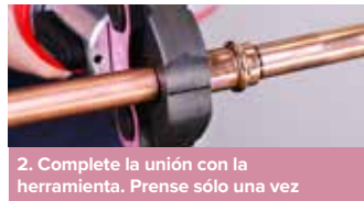
2. Complete la unión con la herramienta. Preñe sólo una vez