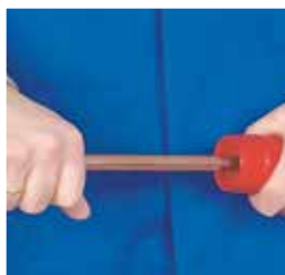
2. Rebabado 2. Rebarbar