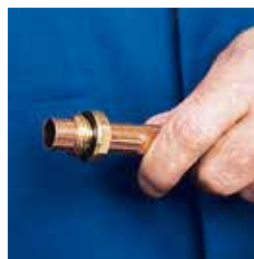
3. Insertar el accesorio 3. Inserir o acessório