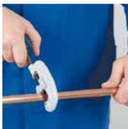
1. Corte de tubo 1. Cortar o tubo