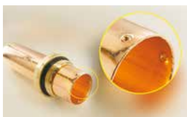
5. Gráfico de muescas 5. Gráfico das marcas