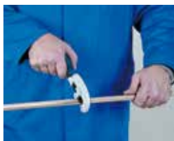
1. Corte de tubo 1. Cortar o tubo