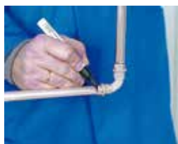
5. Marcar la inserción 5. Marcar o ponto da inserção