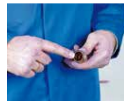
3. Comprobación de la junta tórica 3. Verificação da junta tórica