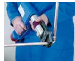
6. Prensado 6. Prensado