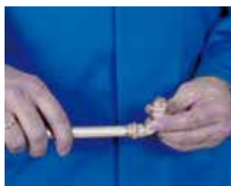
4. Inserción del tubo en el accesorio 4. Encaixar o tubo no acessório