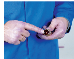
3. Comprobación de la junta tórica 3. Verificação da junta tórica