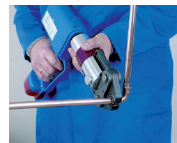
6. Prensado 6. Prensado