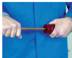
2. Rebabado 2. Rebarbar