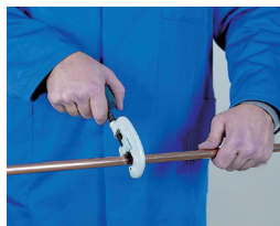
1. Corte de tubo 1. Cortar o tubo