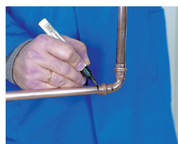
5. Marcar la inserción 5. Marcar o ponto da inserção