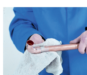
6. Limpieza final 6. Limpeza final