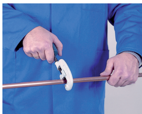
1. Corte de tubo 1. Cortar o tubo