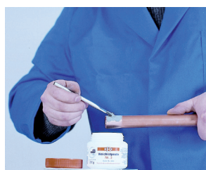
4. Aplicación del decapante 4. Aplicação do decapante