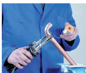
5. Aplicación de la soldadura 5. Aplicação da soldadura