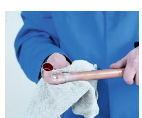
6. Limpieza final 6. Limpeza final