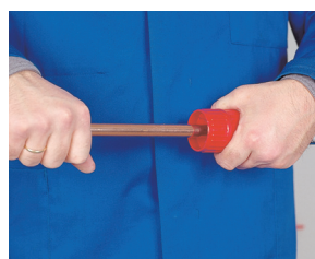
2. Rebadado 2. Rebarbar