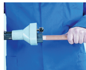
3. Limpieza exterior del tubo 3. Limpeza exterior do tubo