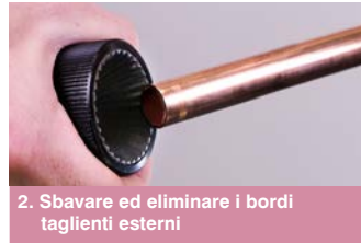
2. Sbavare ed eliminare i bordi taglienti esterni