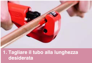
1. Tagliare il tubo alla lunghezza desiderata