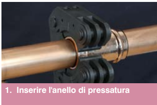
1. Inserire l'anello di pressatura