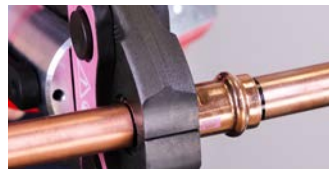
2. Completare la giunzione utilizzando unicamente utensili omologati