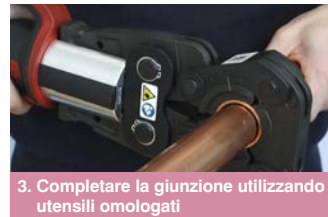
3. Completare la giunzione utilizzando utensili omologati