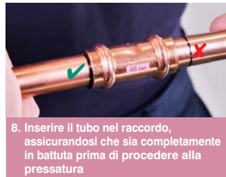
8. Inserire il tubo nel raccordo, assicurandosi che sia completamente in battuta prima di procedere alla pressatura