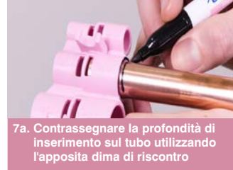
7a. Contrassegnare la profondità di inserimento sul tubo utilizzando l'apposita dima di riscontro