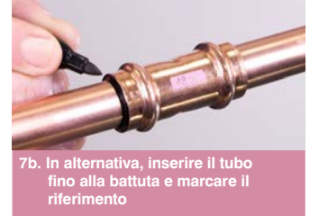
7b. In alternativa, inserire il tubo fino alla battuta e marcare il riferimento