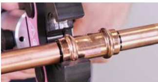
1. Allineare la ganaschia perpendicolarmente al raccordo