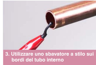
3. Utilizzare uno sbavatore a stilo sui bordi del tubo interno