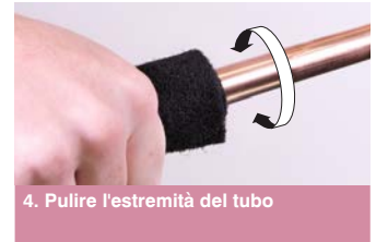
4. Pulire l'estremità del tubo