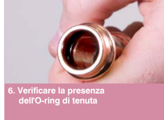
6. Verificare la presenza dell'O-ring di tenuta