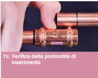
7c. Verifica della profondità di inserimento