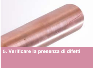
5. Verificare la presenza di difetti