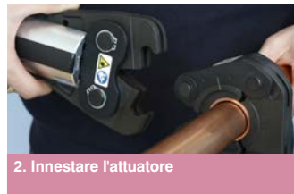
2. Innestare l'attuatore