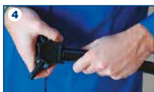
4 Tubo: sbavatura calibratura