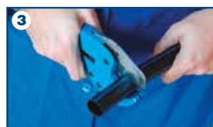
3 Tubo: taglio