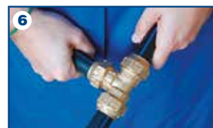
6 Giunzione completata