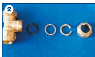
2 Terminale di giunzione: componenti