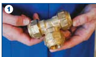
1 Terminale di giunzione